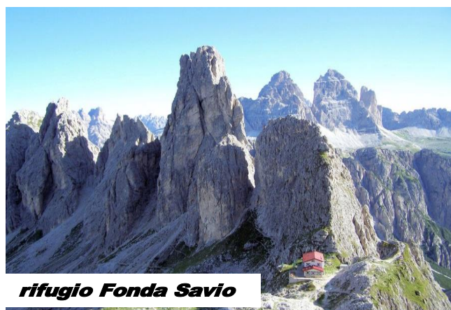
rifugio Fonda Savio