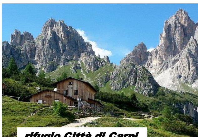
rifugio Città di Carpi

Al Lago Antorno - Bellissimo percorso, assai suggestivo, in un ambiente di alta montagna che vi farà scoprire un altro ramo dei Cadini. Lasciato il rifugio Fonda Savio si scende nel vallone, vi consiglio di fermarvi ogni tanto e guardare all'indietro potrete scorgere la bellezza e la particolarità del rifugio arroccato sopra l'incantevole balconata del Passo dei Tocci. Il sentiero 115 è ben visibile fino ad imboccare il versante nord del Cadin dei Tocci, poi scende con pendenza più accentuata fino al Pian degli Spiriti (mt 1880) giungendo fino alla strada carrabile per le tre cime (ore 1,45 totale giornata ore 4,15). Si gira a destra (attenzione alla viabilità) e dopo una breve salita si arriva al lago Antorno dove troveremo il pullman.